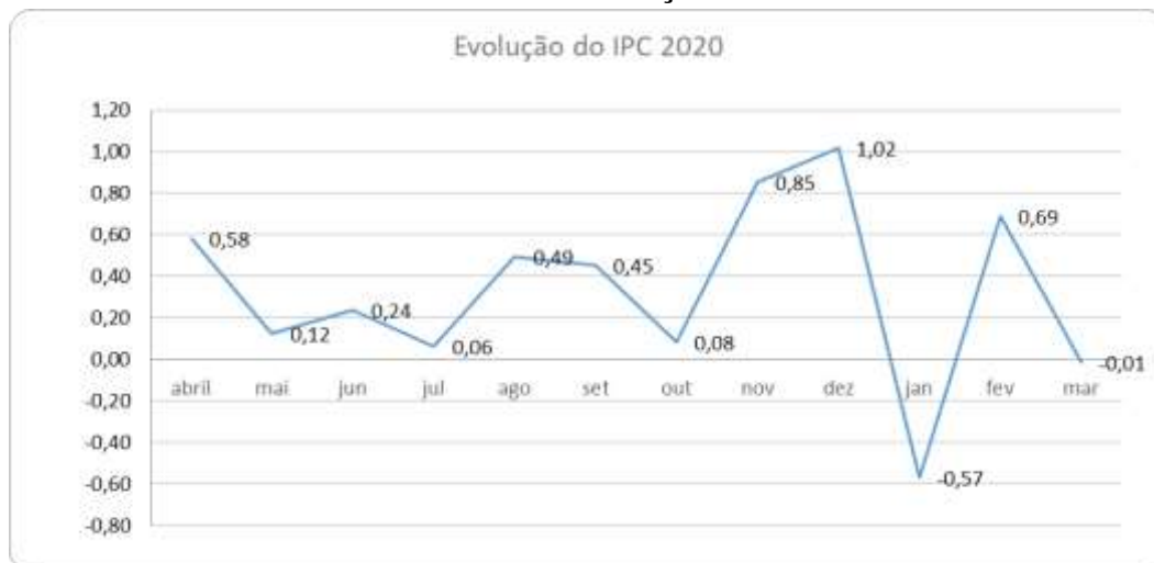
Gráfico 2 – IPC/MBA entre abril de 2019 e março de 2020

Fonte: LAINC-MBA, UNIFESSPA e FAPESPA, elaborado pelo autor em 2020