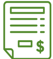
Gráfico 3: Custo por Grupo de Despesa

A seguir, e observando no Gráfico 2, os grupos de despesa que mais se destacaram dentre os doze que compõem a CBCF, foram: “Despesas Gerais”, “Serviços”, “Carnes” e “Hortifrúti e Granjeiro”. O grupo de “Despesas Gerais” continua apresentando a maior participação em relação ao total dos gastos, sendo responsável, em abril, por “ 30,92% ” do custo da cesta, comprometendo R$497,75 (quatrocentos e noventa e sete reais e setenta e cinco centavos) do orçamento familiar, o que corresponde a 41,07% do Salário Mínimo Nominal e 44,40% do Salário Mínimo Líquido. O segundo, Serviços, teve uma participação de “ 16,68% ”, compromete, com seus R$ 268,51 (duzentos e seiscentos e oito reais e cinquenta e um centavos), 22,15% do Salário Mínimo Nominal e 23,95% do Salário Mínimo Líquido. Esses dois grupos são responsáveis por 47,59% dos gastos básicos da família, enquanto que as carnes comprometem 15,70% do orçamento familiar, ultrapassando de forma histórica, um dos principais grupos não alimentícios, e o grupo hortifrúti e granjeiro é responsável por mais 10,92% , ou seja, os 4 grupos com maior participação, são responsáveis por 74,21% do valor da CBCF.